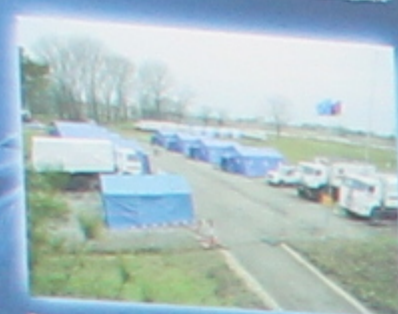
Ремонтный пункт управления (РПУ) Краснодарского края.