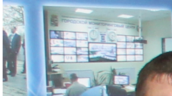
Экстренные оповещения населения об угрозе ЧС, информация о состоянии системы централизованного управления в кризисных ситуациях, о СДМ и силе гражданской обороны.