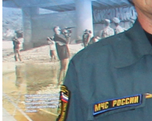
Диспетчерская система высшего звена служб.

повышенно тически все ечение бе уществляет Краснодар ажи по к