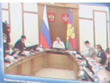
Комитет по предпринимательству и лицензированию ЧС и обеспечению массового безопасности администрации Краснодарского края руководит деятельностью сил и средств территориальной подсистемы РСЧС.