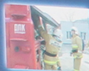
Добровольные пожарные активно обучают граждан (информационный пункт) для участия в профилактике, ликвидации последствий, тушении пожаров, оказании первой помощи пострадавшим (Общероссийский номер 01, 05, 2019, № 100-01).

Краснодарский край – федерального округа Ро ная водами Азовского и 76 000 км. кв. за прикубанья и Таманско леса и горные мас Кавказа, 13 тысяч рек проживают свыше 5 млн. ставители более 100 нац Основа экономики кр мышленный, топливно- транспортный, пром курортный комплексы.